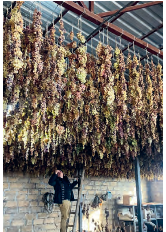
Ein Teil der weissen Trauben wurde spät geerntet und dann zum Trocknen aufgehängt: daraus wird der Süsswein NOA Gold.

Die Weinbereitung begann mit Weiss- und Roséwein nach dem vom Winzerteam entworfenen Plan. Noch vor Mitte Dezember konnte die Maische aller Rotweine gepresst und die Gärung abgeschlossen werden. Wir freuen uns über einen qualitativ sehr erfreulichen Jahrgang 2024.