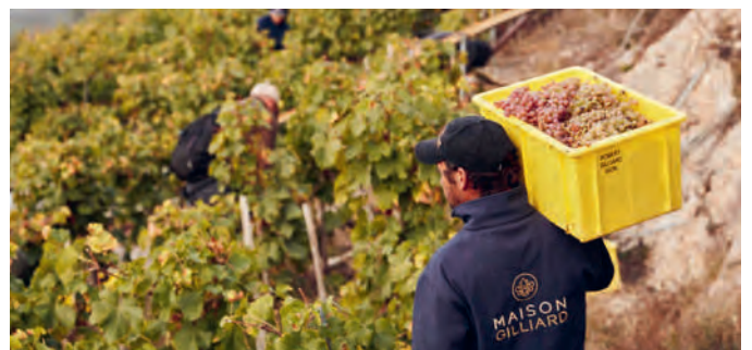
Alles Handarbeit und viele Traglasten.