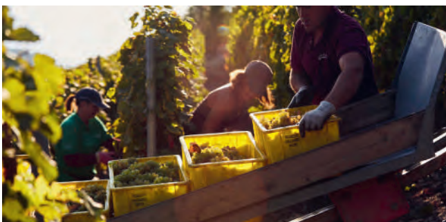
In den steilen Hängen hilft das Schienen-Töff.